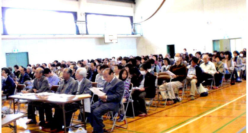
(熱心に説明を聞く参加者)